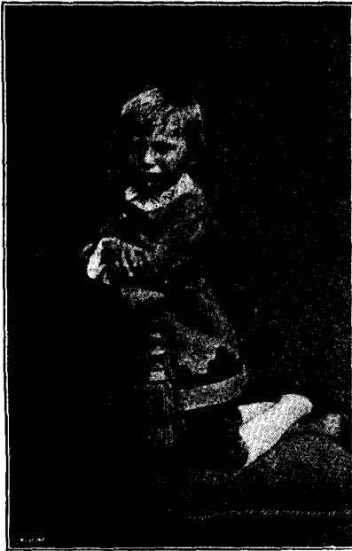
Podobizna Theodora Nováka z roku 1884.

Všechny myšlénky Theodora Nováka nesoucí se k domovu, všechny jeho vzpomínky splácené rodišti, sedaly na lesnaté stráně českomoravského pohoří, bloudily v hlubokých horských údolích okolí rodné Litomyšle, trhaly bělostné sedmikvítky Strakovských lesů a fialové vřesy Budislavských skal, jež pro ně vzkvétaly daleko spíše než stříbrná lilie starobylého města Litomyšle, vyrůstající v studeném stínu elegického renaissančního zámku a zasmušilé a téměř opuštěné piaristické kolleje. Tradice a ovzduší česko-bratrského druhdy města nedotkly se ani v dětských letech duše dítěte, jehož rodný dům tměl se úplně na periferii města, nad polovenkovskými chaloupkami a domky předměstí Záhradí, tonoucího v bohaté zeleni ztichlých zahrad a posunutého hlu-